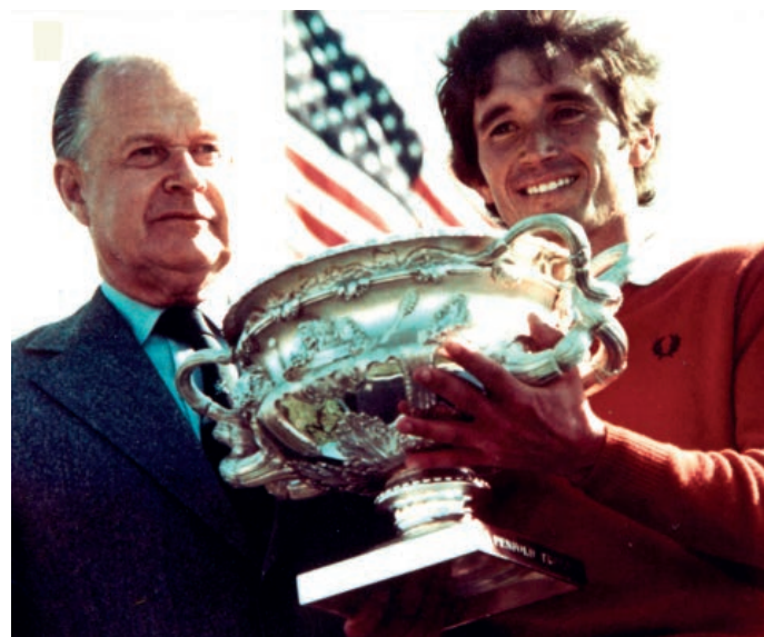
Manolo Piñero. Campeón del Mundo de Golf. California 1976. Manolo Piñero. Golf Champion. California 1976

Pero Sun Breeze no es solo localización, tanto el diseño como la construcción de su complejo residencial son el resultado de exigir siempre, un respeto por el entorno y unos altos estándares de calidad para nuestros proyectos, no solo con respecto al cuidado en el diseño, en el desarrollo o en el acabado, sino también en la elección de los materiales con los que trabajamos.